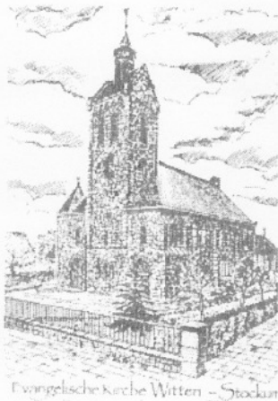
Evangelische Kirche Witten - Stockum

Unsere Gemeinde ist ein wachsender Baum, verwurzelt in Gottes Wort. Sie ist ein Lebensraum, in dem alle Menschen Lebendigkeit, Beständigkeit und Verbundenheit erfahren können. Wir wollen mit den Menschen Gottes Liebe als Lebensgefühl erfahren und erfahrbar machen.