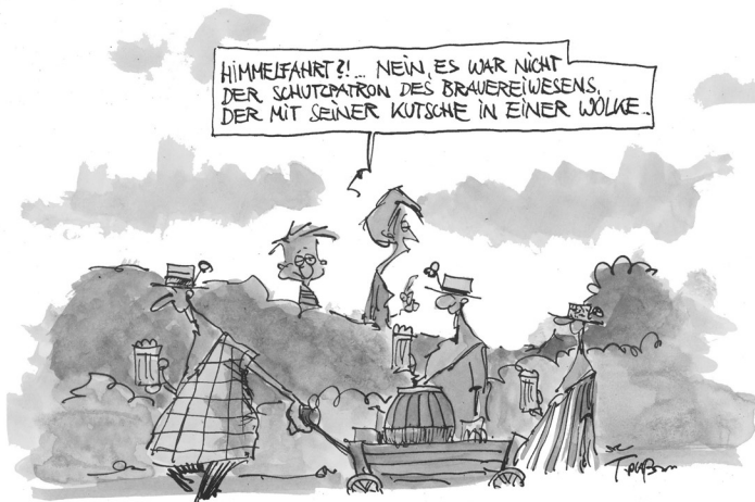
RELIGION - GRUNDWISSEN, KAPITEL IX, FEIERTAGE

Auch an Christi Himmelfahrt feiern wir um 10 Uhr